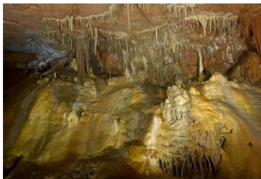
le décor des parois de la grotte